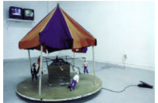
Peter Geschwind "Merry-go-round" (1995)