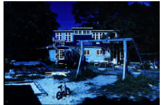
Joachim Koester "Day for Night, Christiania" (1996)