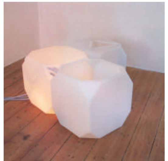
N55 "HYGIENE SYSTEM" (1997)