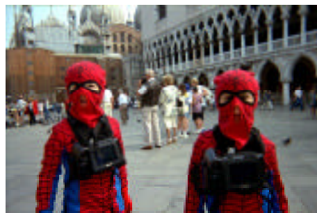
Steven Bachelder "Vicarious qualities through incremental repetition or Super heroes" (1997)