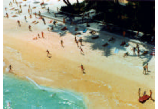
小粥丈晴 + 雄川愛 "97.2.8" (1997)