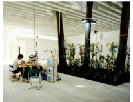
Henrik Håkansson "Out of the Black into the Blue" (1997)