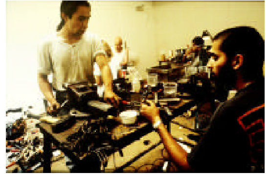
Jens Haaning "Weapon production" (1995)