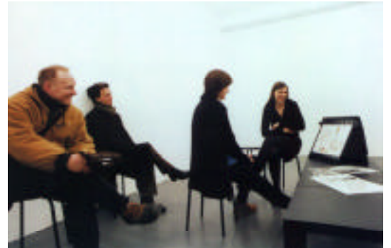
Elin Wikström "A Portrait of Mr Weimar" (1998)

本展では東京に長期間滞在して行うタイプのプロジェクトを計画中。 ナディッフにて、随時、情報を告知します。