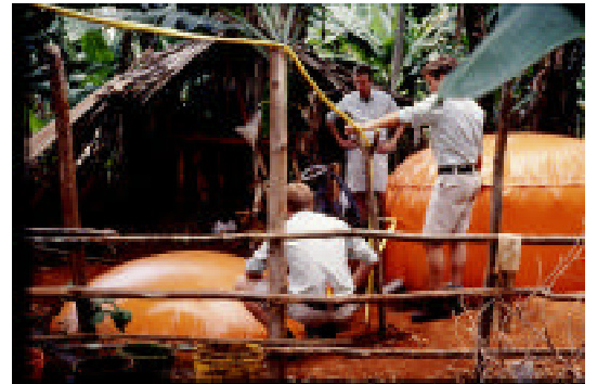
Superflex "Biogas" in Africa (1997)