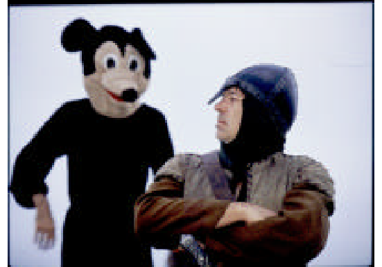
眞島竜男 "California" (1997)