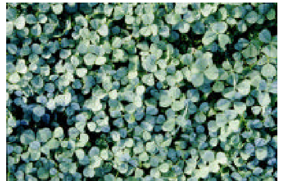
Nikolaj Recke "4-Clover field" (1998)