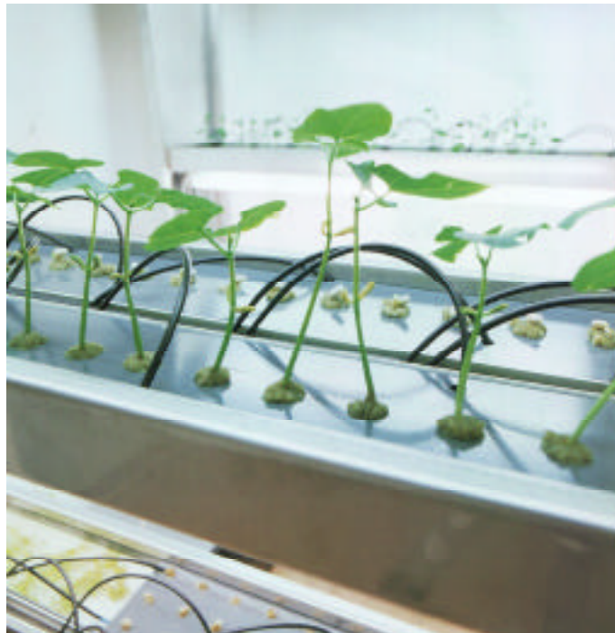
N55 "HOME HYDROPONIC UNIT" (1997)